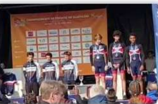
Podium minimes par équipe