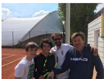
Equipe 3 séniors Hommes