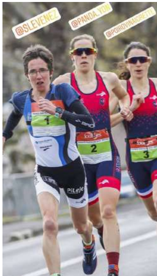
Course à pieds Filles