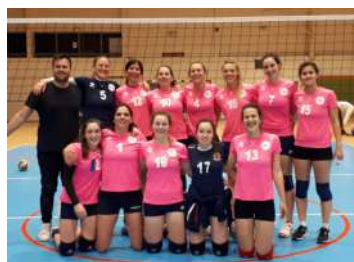
Régionales Séniors Filles