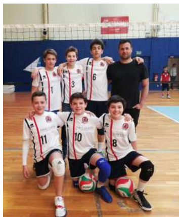
M13G Champions IDF

Merci à tous, Parents, Dirigeants et Entraîneurs de leur avoir offert ce petit plaisir !