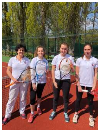
Equipe séniors dames