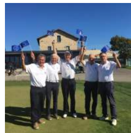
Golfeurs Seniors 2

Les Seniors femmes se maintiennent en première division. Les seniors hommes se maintiennent en troisième division.