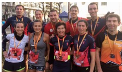
les stadistes à l'arrivée