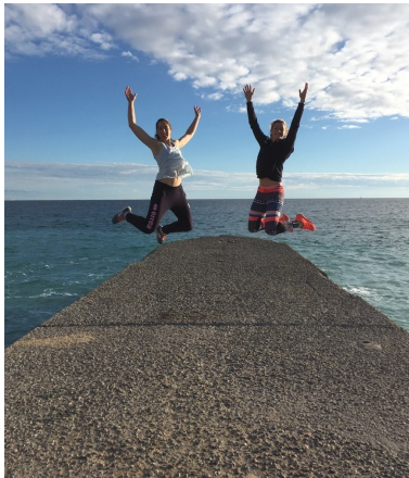
Entre 2 victoires.....