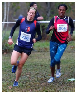
Marion à la bagarre