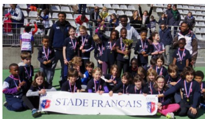
Animation à PUC