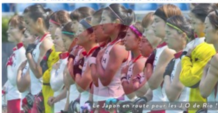
Le Japon en route pour les J.O de Rio !