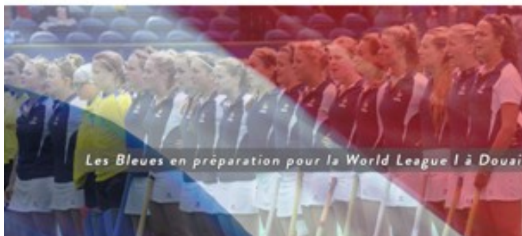
Les Bleues en préparation pour la World League I à Douai