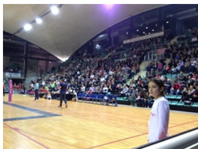
2500 spectateurs conquis par les Mariannes