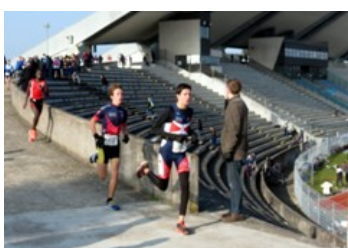
Othello et Eugène