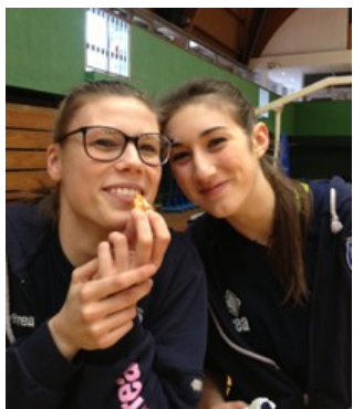
Des blessées .... appréciant les chouquettes